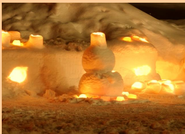
スノーキャンドル