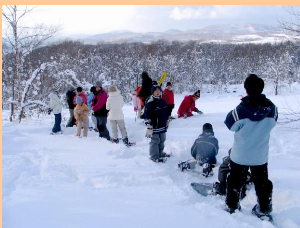
スノーシュートレッキング