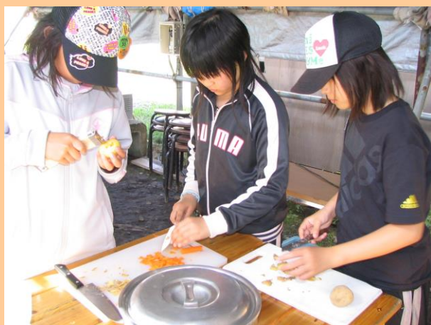
野外炊飯（カレー作り）