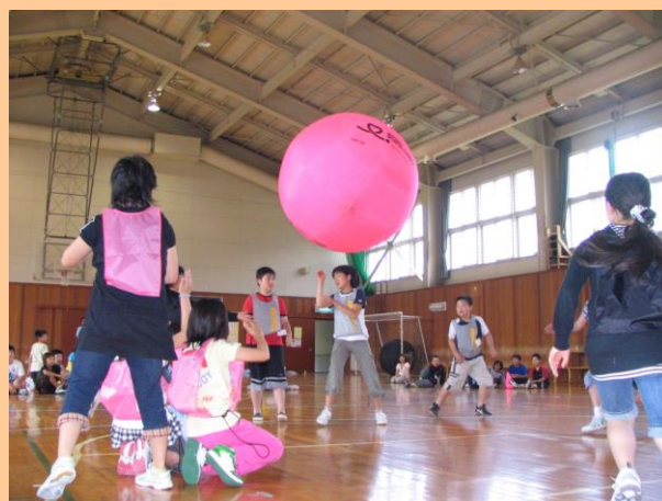
ニュースポーツ体験